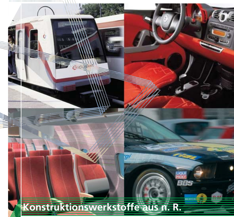
Bilder: Fachagentur Nachwachsende Rohstoffe e. V. & Four Motors PR GmbH, mehwerk, designlab, Alaborn Power AG, laurecia Innenraumsysteme GmbH, Design: Sperllich Consulting GmbH

Ihr Ansprechpartner für Innovationen mit Nanomaterialien Geschäftsstelle Nano- und Materialinnovationen Niedersachsen (NMN) e. V. c/o Sperllich Consulting GmbH P.O. Box 200 234, 37087 Göttingen Tel. +49 (551) 49 607 0 , Fax +49 (551) 49 607 49 mail@nmn-ev.de, www.nmn-ev.de